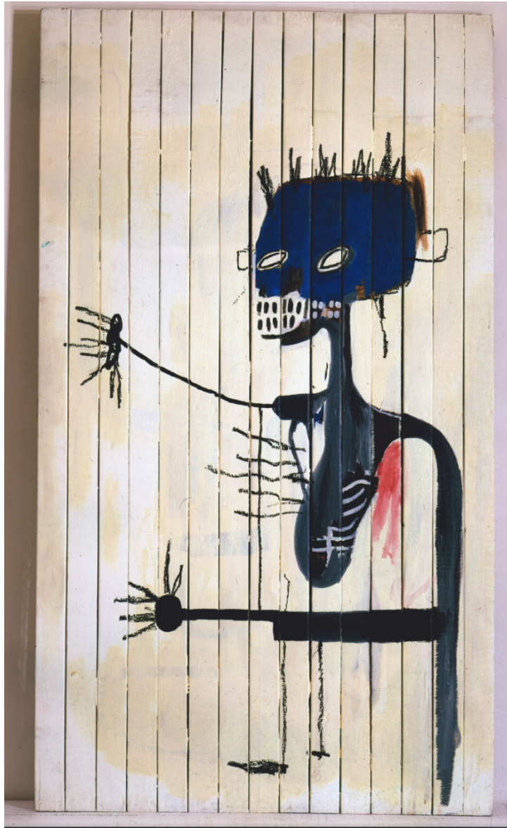
Jean-Michel Basquiat (American, 1960-1988)

이미지를 이용하실 경우, 반드시 아래의 크레딧 정보를 명시해야 하며, 이미지 편집은 사전 동의 없이 편집이 불가합니다.