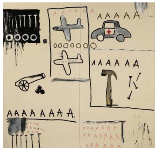
Untitled, 1981, Acrylic and oilstick on canvas

바스키아는 1977년-79년에는 SAMO라는 이름으로, 1980년부터 왕관기호와 저작권의 의미를 뜻하는 © 라는 공증의 기호를 사용한다. 이 왕관이 상징하는 의미는 작품에 등장하는 인물들에게 존경과 찬미를 나타내기도 하고, 후에 바스키아만의 고유의 기호 곧 날인으로 쓰이기도 한다. 그 예로 이번 전시작품 중 자동차와 비행기가 그려진 1981년작 <무제 Untitled>는 붉은 십자가의 구급차와 비행기들이 마치 어린아이의 그림처럼 묘사되어 그의 유년시절 교통사고에 대한 암시를 나타낸다. 뿐만 아니라 그의 고향인 브룩클린에 위치한 라구아디아 공항과 케네디 국제 공항에서 착륙을 암시하는 비행기