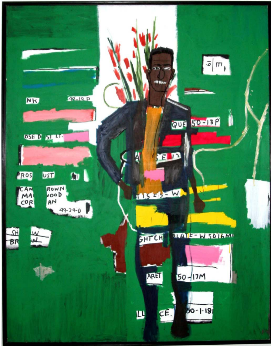
Jean-Michel Basquiat (American, 1960-1988)

이미지를 사용하실 경우, 반드시 아래의 크레딧 정보를 명시해야 하며, 이미지 편집은 사전 동의 없이 편집이 불가능합니다.