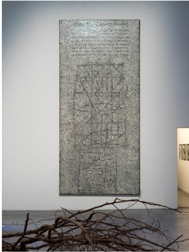
제 56 회 베니스 비엔날레 《All the World's Futures》 전시전경, 아르세날레, 베니스, 이탈리아, 2015