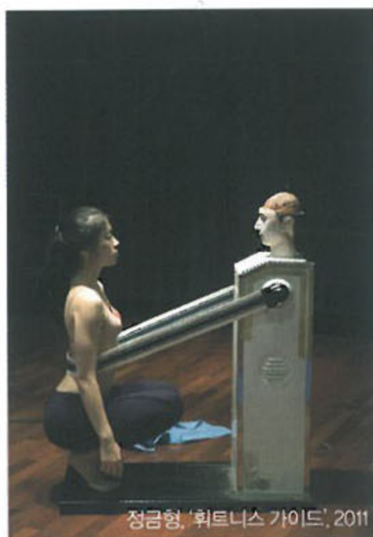
정금형, '휘트니스 가이드', 2011

<Kyuchul Ahn> 'National Museum of Modern and Contemporary Art's Hyundai Motor Series', founded in 2014, selects and supports an artist every year. The second artist selected by the program this year is Kyuchul Ahn, known for portraying social irregularities metaphorically. His work has humorous images, but they imply sharp criticism and political messages. National Museum of Modern and Contemporary Art, Seoul (Sep. 15-Feb. 21, 2016) INQUIRY 3701-9500