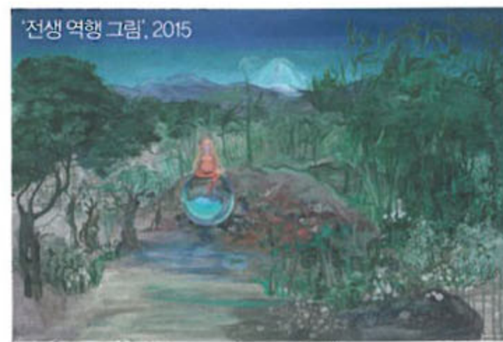
전생 여행 그림, 2015