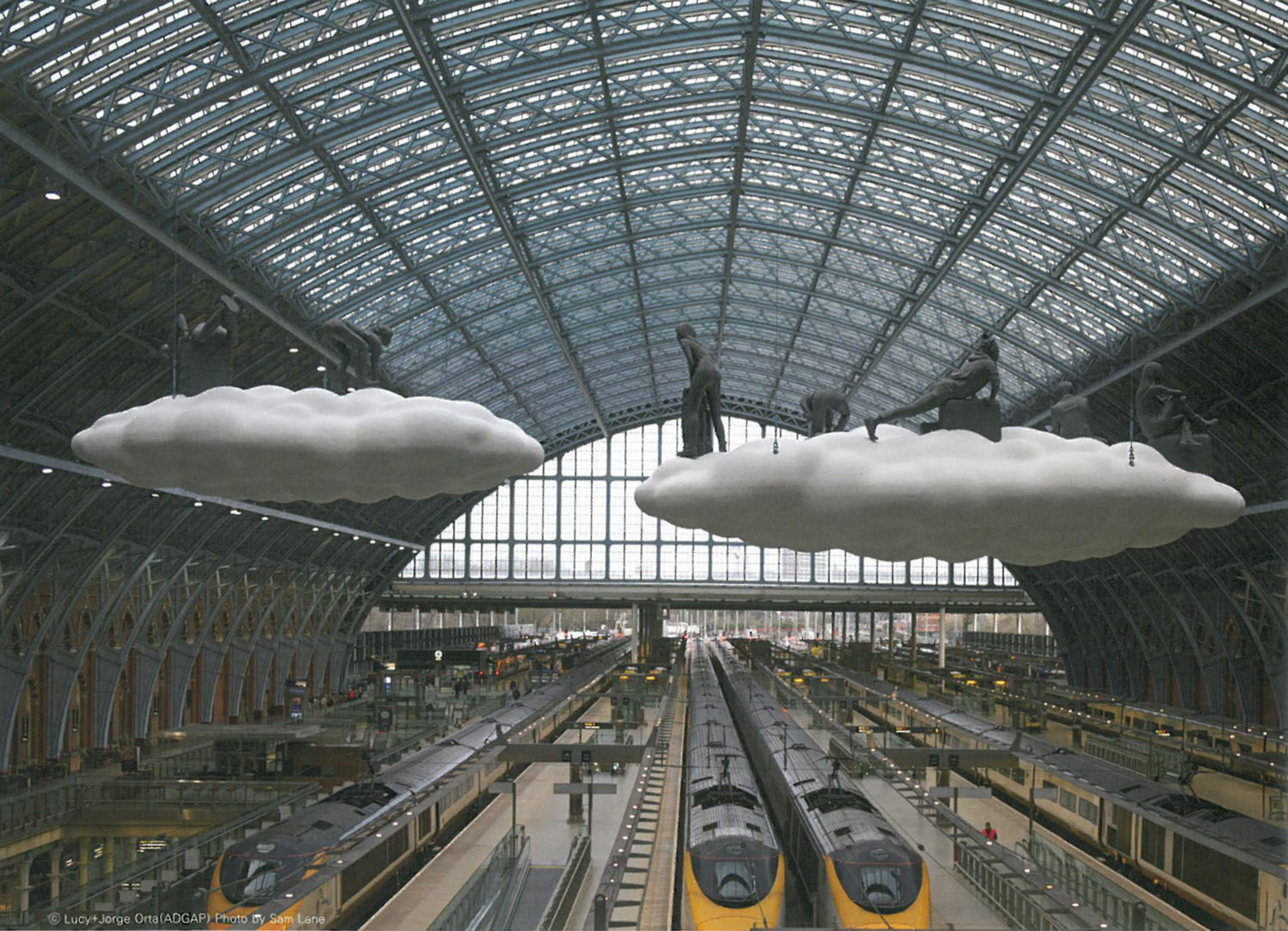
© Lucy+Jorge Orta(ADGAP) Photo by Sam Lane