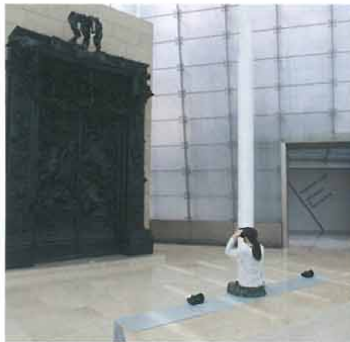
▲ 로댕의 '지옥의 문'에 대한 정연두식 재해석, '베르길리우스의 통로'(2014). 오콜러스 리프트라는 3D 기기를 쓰면, 실사로 살아 움직이는 현대인의 초상을 목도할 수 있다.