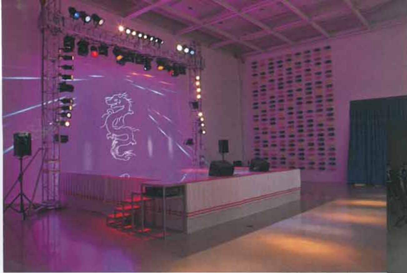
▲ 오로지 걸그룹 크레용팝을 위해 만들어진 무대, '크레용팝 스페셜'(2014). 무대 곁에 설치된 거대한 스크린에서는 '팝저씨'들이 모여 진행했던 퍼포먼스 영상이 상영된다.