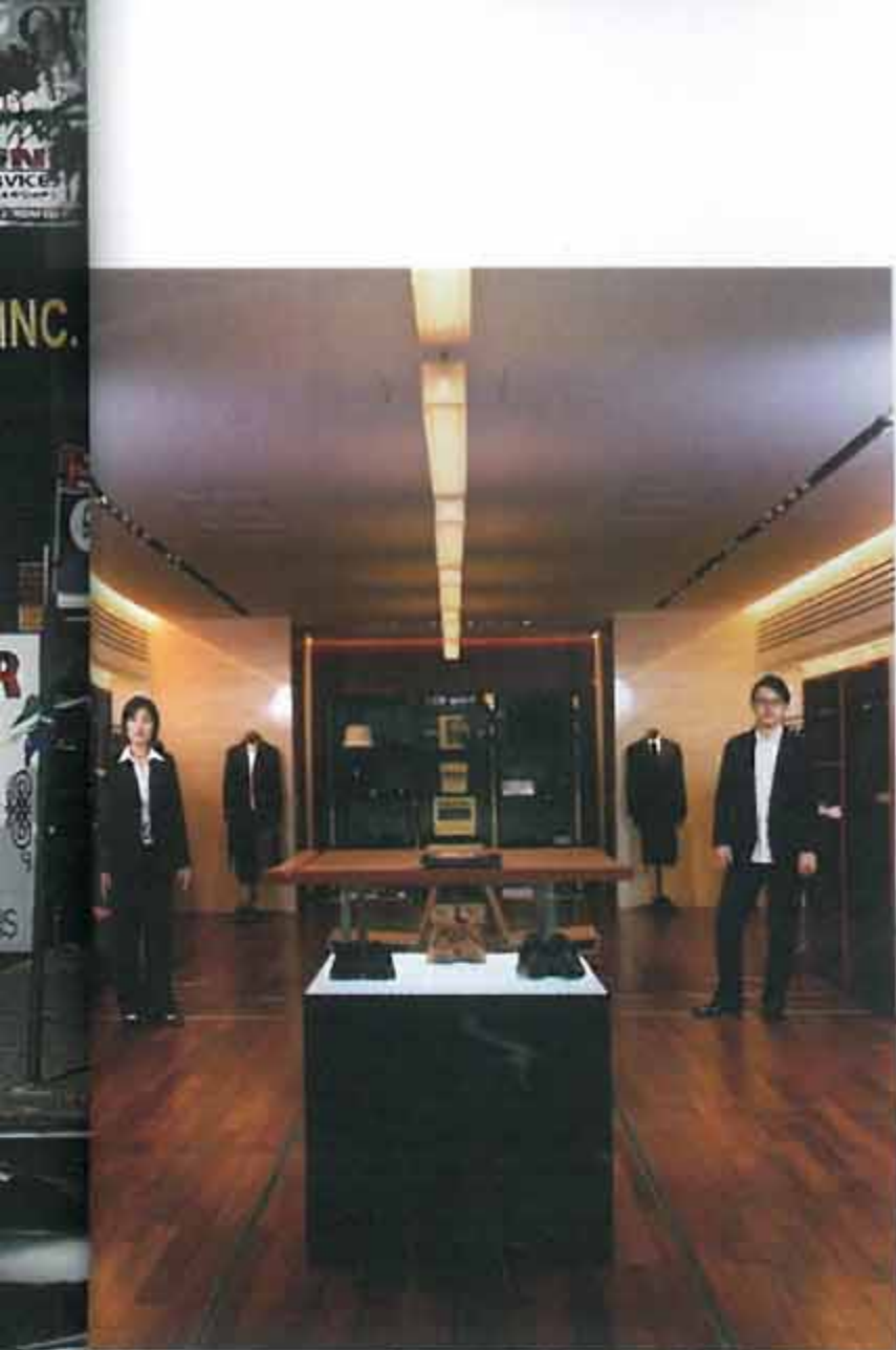
◀ 명품 브랜드의 점원들을 건조한 시선으로 담아낸 '도쿄 브랜드 시티'(2002). ▼ 획일화된 아파트 섬에 살고 있는 서른두 가정을 찍은 작품 '상록타워'(2001).