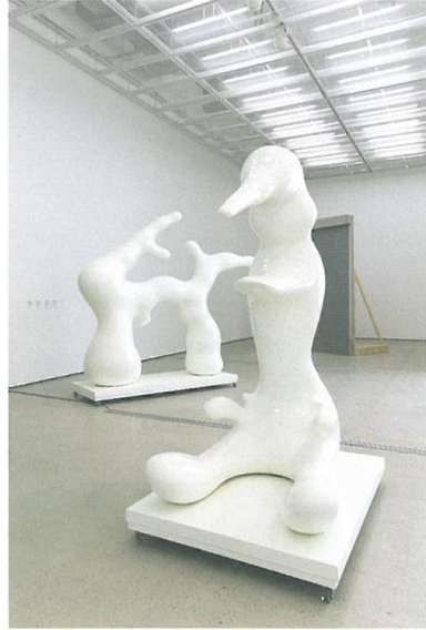
올해의 작가상 2016 전시 기간 2016. 08. 31 ~ 2017. 01. 15 장소 국립현대미술관 서울관 1, 2전시실