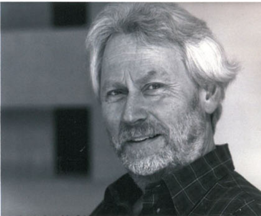
▲ Donald Judd_Installation View at K3 ▼ Portrait of Donald Judd · 1991

도널드 저드는 1960년대 초부터 1994년 타계할때까지 20세기 미술의 역사를 근본적으로 바꾸는 자신만의 독특한 작품세계를 구축하