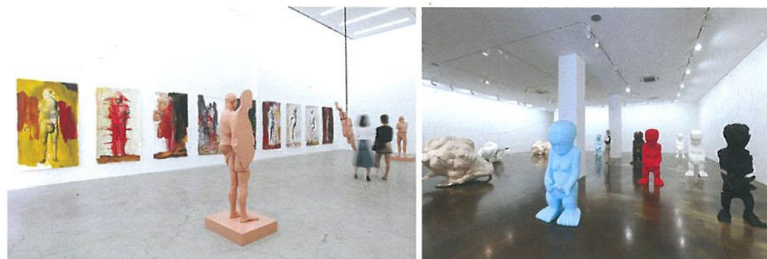
왼쪽 폴 매카시 〈Cut Up〉 연작 전시 전경 오른쪽 폴 매카시 〈Picabia Idol〉 연작 전시 전경