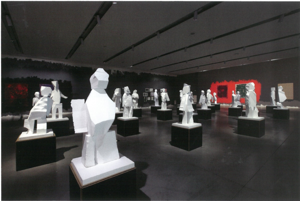
위 김홍석 《불완전한 질서개발(의지)》 스티로폼 등(총 24점), 각 100-140cm(H) 2019 아래 김홍석 《인간질서(서예, 공과금 정리, 자녀를 위한 책상, 사진 왼쪽) (노동법, 예술, 사랑을 위한 책상)》 혼합재료, 가변크기 2019 왼쪽 페이지 김홍석 《인간질서(사과탑)》 혼합재료, 스테인리스 스틸 95×95×110cm(H) 2019