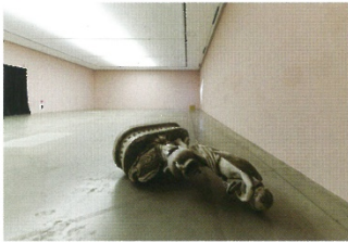
왼쪽 서현석 <면지극장2> 프로젝트갤러리1 설치 2019 오른쪽 서현석 <면지극장1> VR 20분 2019